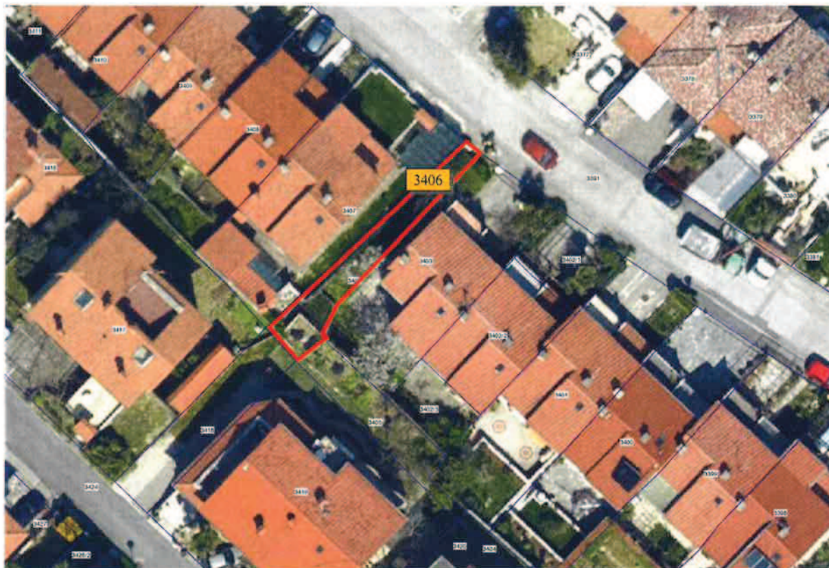
Slika 2: Ortofoto posnetek + DKN (GIS Občine Izola)