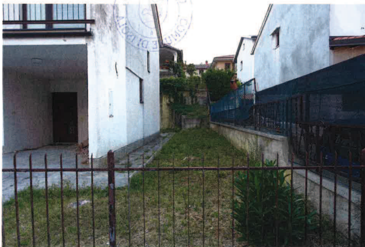
Slika 3: Fotografija s terenskega ogleda z dne 29. 8. 2016