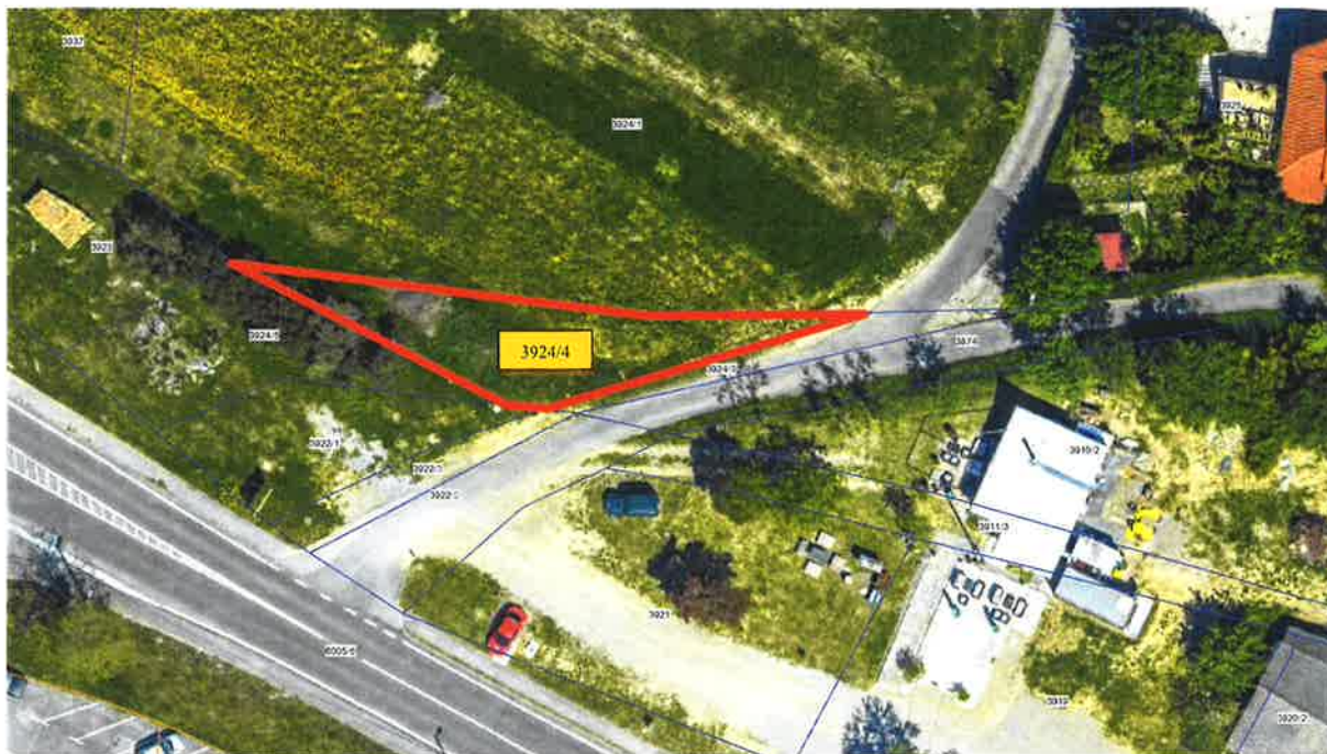
Slika 1: DOF 2017 in DKN (GIS Občine Izola)

Z digitalnega ortofoto posnetka (DOF 2017) in zemljiškega katastra (GIS Občine Izola) je razvidno, da je parcela št. 3924/4, k.o. Izola nepozidano zatravljeno zemljišče ob dostopni javni poti.