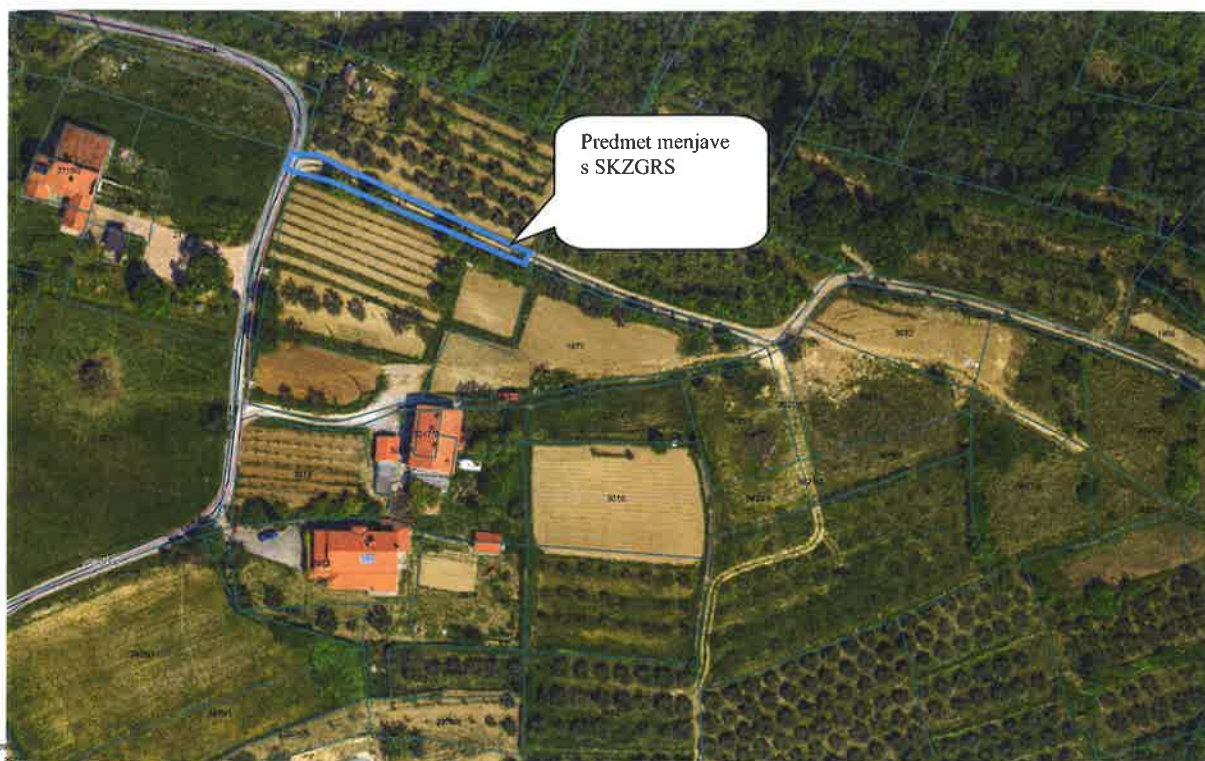
Označen predmet menjave za parc. št. 3013/2