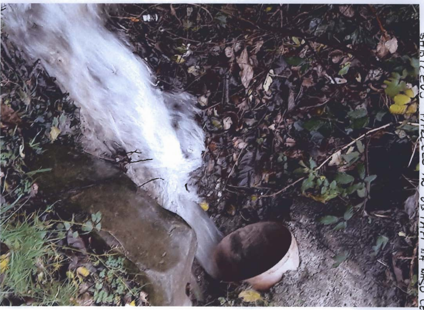
VODA Z OBRISNE CESTE IZ TEČE NA ŽABIČEVO PACELO IN OD TAM NA NAŠO CESTO