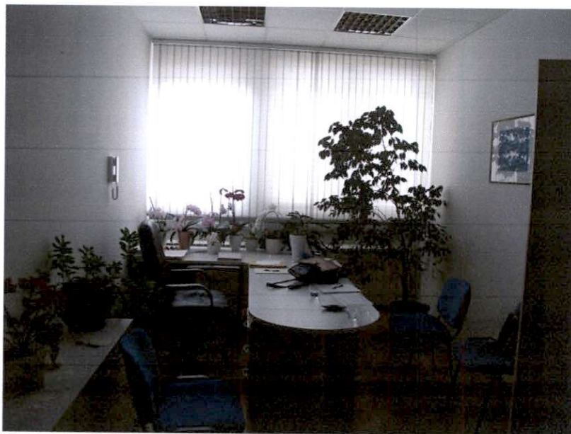
ordinacija 1. del